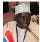
فضيلة الشيخ د. عمر جاه غامبيا (1984)