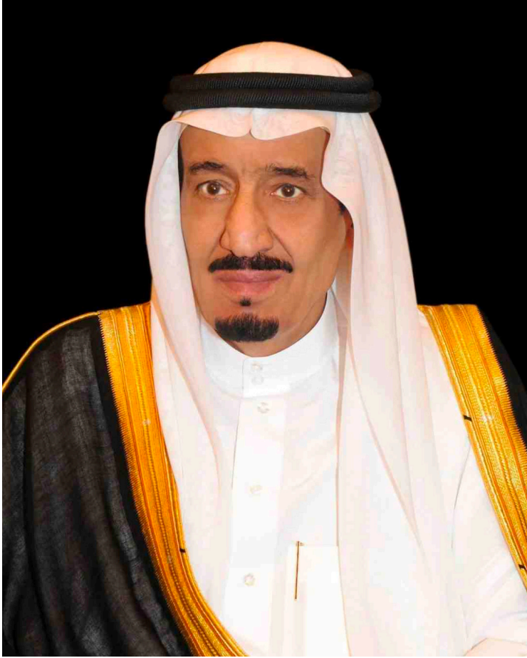
خادم الحرمين الشريفين الملك سلمان بن عبد العزيز آل سعود ملك المملكة العربية السعودية - أيده الله ورعاه -