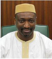
معالي الشيخ أ. د. قطب مصطفى سانو (2000) الأمين العام للمجمع