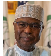
معالي السيد حسين إبراهيم طه (2021) الأمين العام للمنظمة