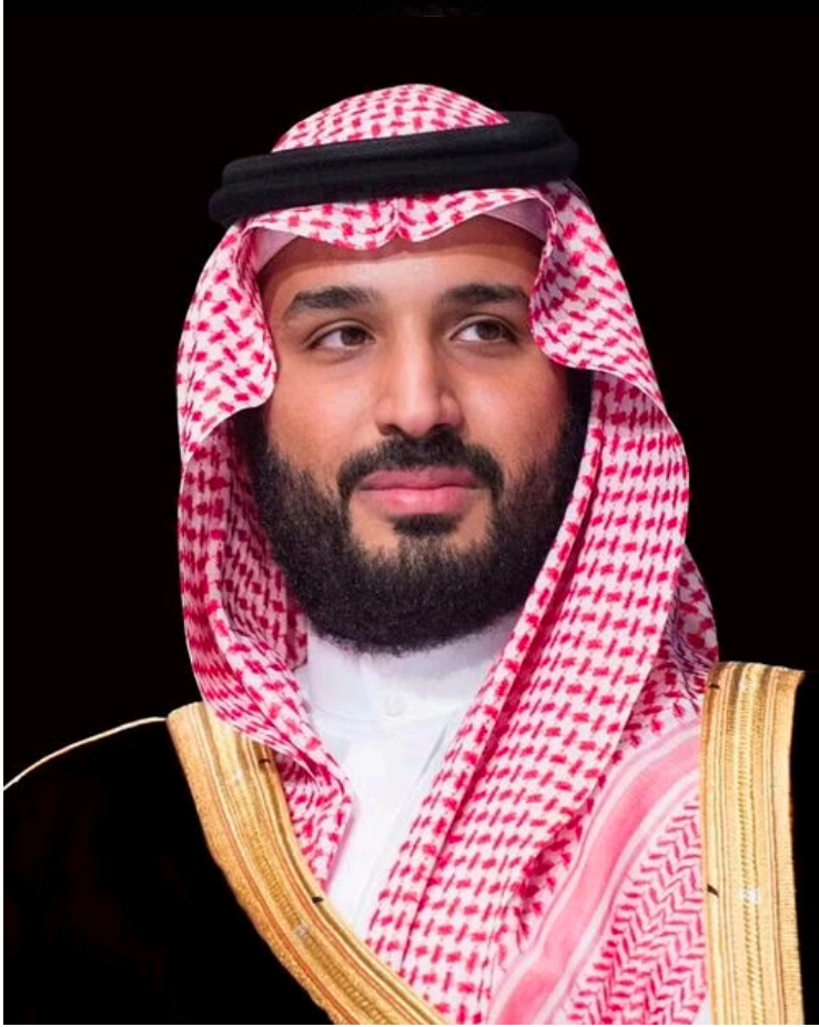
صاحب السمو الملكي الأمير محمد بن سلمان بن عبد العزيز آل سعود ولي العهد، رئيس مجلس الوزراء، - حفظه الله -