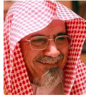
معالي الشيخ الدكتور صالح بن حميد (2007) رئيس المجمع