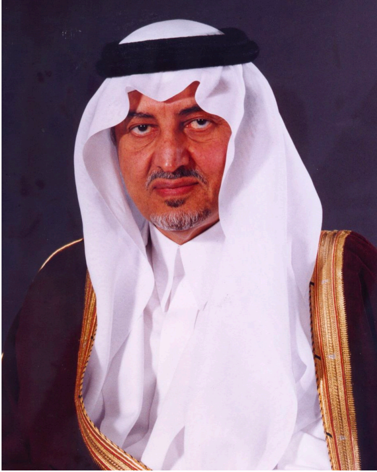
صاحب السمو الملكي الأمير خالد بن فيصل بن عبد العزيز آل سعود مستشار خادم الحرمين الشريفين أمير منطقة مكة المكرمة - حفظه الله -