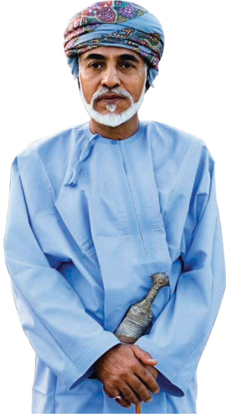
صاحب الجلالة السلطان قابوس بن سعيد المعظم