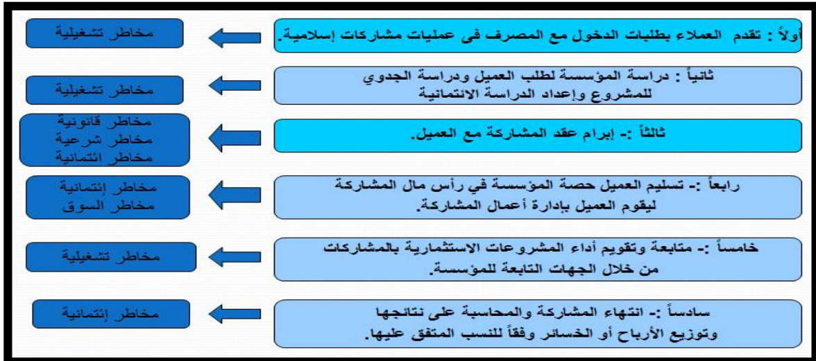
شكل رقم (١) المخاطر المحيطة بمراحل التمويل بالمشاركة.

من مصرف لأخر، وتحيط هذه المراحل بمجموعة من المخاطر والتي يمكن إيجازها كالتالي: