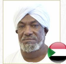
صاحب الفضيلة د. إبراهيم أحمد الشيخ الأمين الضير عضو الهيئة العليا للرقابة الشرعية بنك السودان المركزي