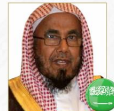
صاحب المعالي أ.د. عبدالله بن محمد المطلق عضو هيئة كبار العلماء واللجنة الدائمة للإفتاء والمستشار في الديوان الملكي السعودي