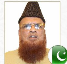
صاحب الفضيلة الشيخ محمد تقي العثماني رئيس الهيئة الشرعية العليا - بنك باكستان المركزي