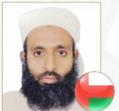
صاحب الفضيلة الشيخ د. أفلاح بن أحمد الخليفي دائرة الإفتاء - سلطنة عمان