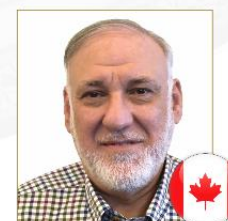
صاحب الفضيلة أ.د. نزيه كمال حماد رئيس الهيئة الشرعية بنك سيتي الإسلامي