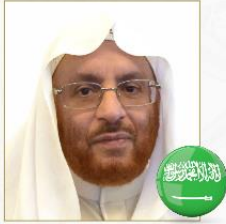
صاحب المعالي د. قيس آل الشيخ مبارك عضو هيئة كبار العلماء السعودية