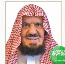
صاحب المعالي الشيخ عبدالله بن سليمان المنيع عضو هيئة كبار العلماء والمستشار في الديوان الملكي السعودي