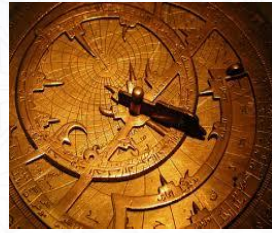
عالم الرياضيات والفلك ومخترع الاسطرلاب محمد الفزالي