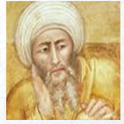
فيلسوف وطبيب وفقيه وقاضي وفلكي وفيزيائي ابن رشد