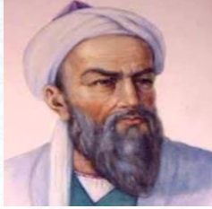
أشهر علماء الطب والكيمياء والرياضيات أبو بكر الرازي