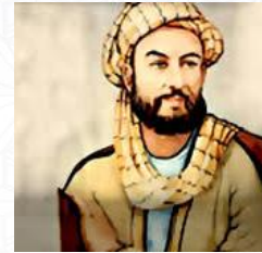
صاحب أضخم موسوعة طبية ابن النفيس