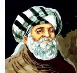
عالم الرياضيات والفلك وأول من توصل الى طول السنة الشمسية ثابت بن قره