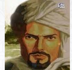
الرحالة المعروف ابن بطوطة