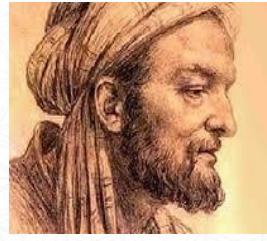
أشهر علماء الكيمياء والفلك والهندسة وعلم المعادن والفلسفة والطب والصيدلة أبو بكر الرازي