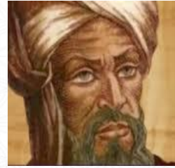
عالم الرياضيات واليه ينسب علم الخوارزميات الخوارزمي