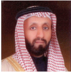
معالي رئيس هيئة الخبراء بمجلس الوزراء الأستاذ محمد بن سليمان العجاني