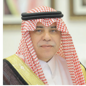
معالي وزير التجارة والاستثمار الدكتور ماجد بن عبدالله القسبي