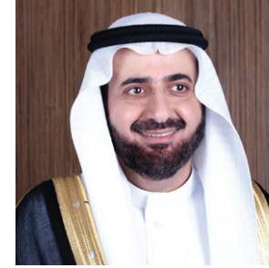
معالي وزير الصحة الدكتور توفيق بن فوزان الربيعية