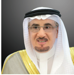
معالي وزير العمل والتنمية الاجتماعية الدكتور مفرج بن سعد الحقباني