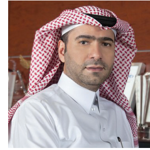
معالي وزير الإسكان الأستاذ ماجد بن عبدالله الحقييل