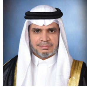
معالي وزير التعليم الدكتور أحمد بن محمد العيسى