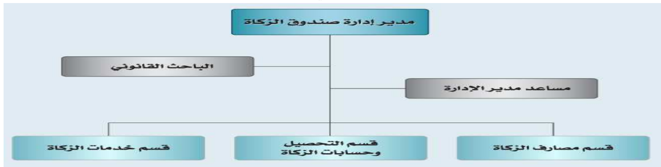
الشكل رقم (01): الهيكل التنظيمي لصندوق الزكاة القطري

ب- الرؤية: العمل على تطبيق فريضة الزكاة، وتحقيق التكافل الاجتماعي.