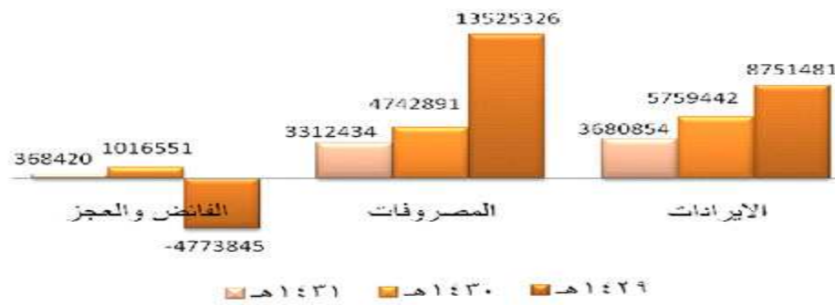
شكل رقم (02):مقارنة لتكلفة مشروع إفطار صائم للسنوات 2010/2009/2008

المصدر: صندوق الزكاة القطري، مشروع إفطار صائم ، http://www.zf.org.qa/