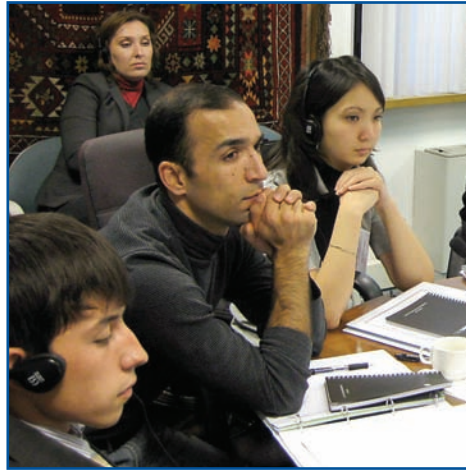
مشاركون ينصتون باهتمام في أحد برامج معهد كازاخستان للمديرين، عن العلاقة بين حوكمة الشركات والمشاركة الديمقراطية.

كتبت - إيلينا سوهير، مركز المشروعات الدولية الخاصة وسيرجي فيلين، معهد المدراء بكازاخستان