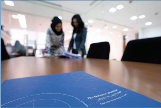
المستثمر الوطني توفر البيانات للشركات في جميع أنحاء الشرق الأوسط وشمال إفريقيا من أجل شفافية أفضل وجذب أعلى للاستثمار.

وفي حقيقة الأمر، فقد بدأ التغيير يأخذ مجراه بالفعل، بينما كان الباحثون يتعاملون ويتفاعلون مع الأرقام، ويقدمون تقاريرهم عن وضع الاتصالات في الشركات الإقليمية. وقد أدت المنافسة بين الشركات المقيدة إلى الاندفاع نحو تحسين مستوياتها، هذا فضلا عما قامت به بعض الجهات التنظيمية من استباق تنفيذ بعض التوصيات، وهو ما تجسد في الاشتراطات التي أصدرتها الهيئة السعودية لسوق الأوراق المالية، والتي فرضت ضرورة الإفصاح عن المساهمين الذين يملكون أكثر من ٥٪ من الأسهم.